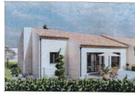
Villa T4 de 103,06 m 2 avec garage de 16,71 m 2 sur un terrain de 446m 2