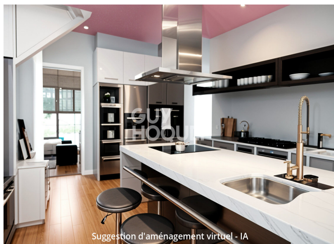
Suggestion d'aménagement virtuel - IA